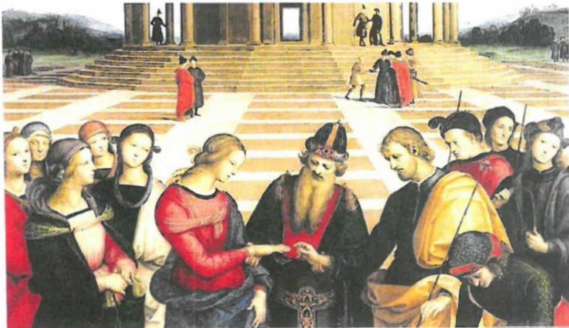
„Vermählung Mariä“, Raffael (1504)

Maria, breit den Mantel aus, mach Schirm und Schild für uns daraus; lass uns darunter sicher stehn, bis alle Stürm vorübergehn. Patronin voller Güte, uns allezeit behüte. Amen.